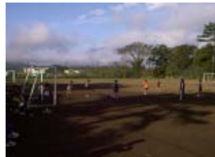
宿のまん前の広いグラウンド。 Jr用であれば2面。土質もGood!

早速、プログラム 初日AMの練習。合宿 = 特訓のイメージ作りのため、ちょっと体力的にハードな練習。でも、みんなニコニコでこなしていました。