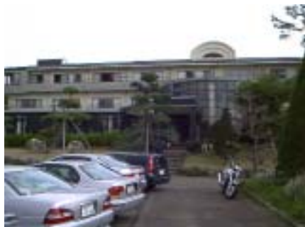
愛ちゃんの正面玄関 結構 モダンな建物

朝早く 第二小に集合。誰も遅れることなく、みんなのワクワク、期待の大きさが伺えました。パパコーチの車に分乗し、Let's go!! 若干 東名 厚木前後で自然渋滞もスイスイと進み、予定通り、10時前に到着。到着後、今回の宿泊所 『愛ちゃん』の御好意で早速部屋に入り、着替えて 練習にGo!