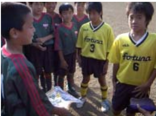
相手キャプテンからパナトを受け取る M.S新キャプテン

試合前、格好いいパナトをもらってみんな大喜び、『AZKのパナトを作ってくれ！』と多くのリクエストが寄せられました！