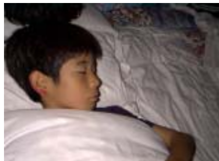
また耳に塗られたR.S君